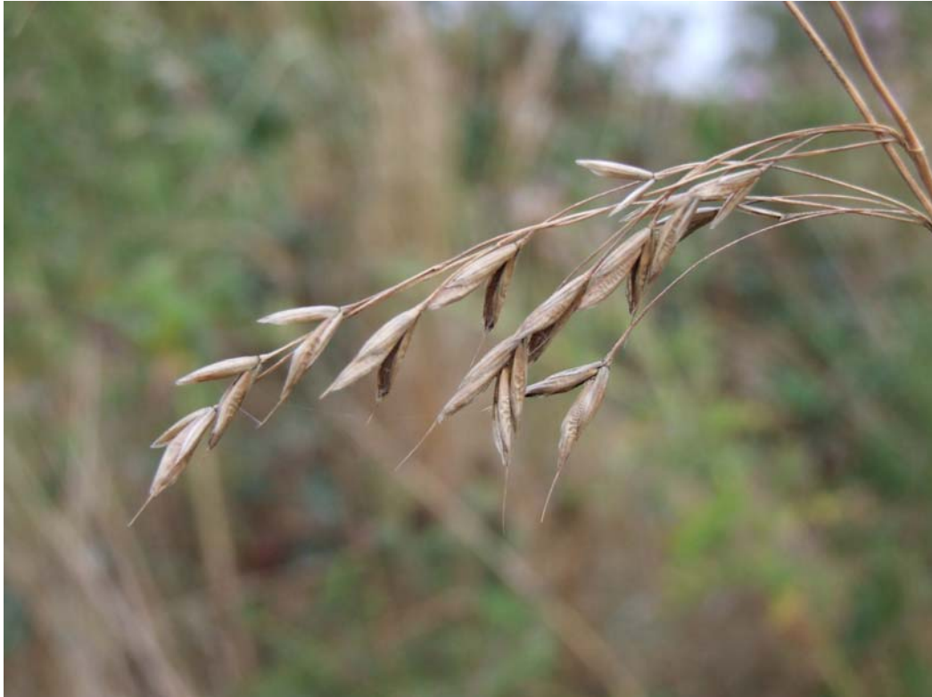
Abb. 1: Reife Ährchen von Bromus commutatus ssp decipiens.