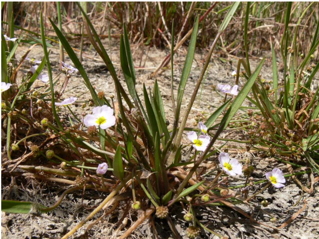
Abb. 3: Baldellia ranunculoides am Nördlichen Binnensee auf Fehmarn.

2024/1 IZ: Kellinghusen Standortübungsplatz, Wald „Koppel“ südl. Teil nahe Hügelgräbern, 1 Ex., 09.02.2008, ML