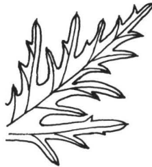
Senecio erucaefolius : obere Blatthälfte