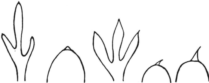
links : Peucedanum palustre, rechts : Selinum carvifolia ( letzte Fiederzipfel, Spitzen der Fiederzipfel )