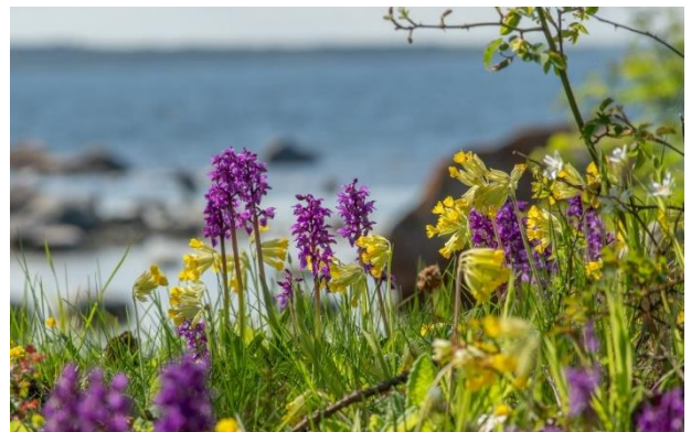
Farbenpracht vor Ostseeufer: Manns-Knabenkraut und Echte Schlüsselblume